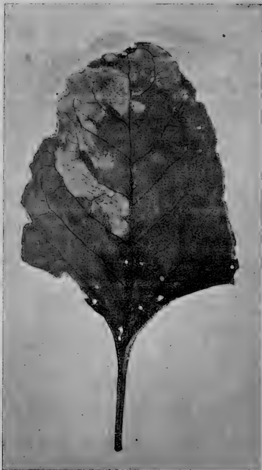
3. A répalégy nyűvének rágása nagy levélben. — Kisebbitett kép. —

míg a répatáblán répa van és a míg meleg napok járnak. Persze nem egyszerre rajzik, hanem akként fejlődik, hogy mindig akad tojás is, nyű is, báb is, de légy is. Némely bábból nyáron nem kel ki a várt 8.—10. napon a légy, hanem a báb olykor heteken